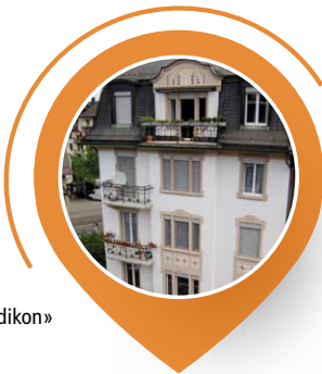
«Foyer Wiedikon» von aussen

Weitere Informationen zu uns und unserer Reise findest du auf unserer Homepage: www.foyerwiedikon.ch