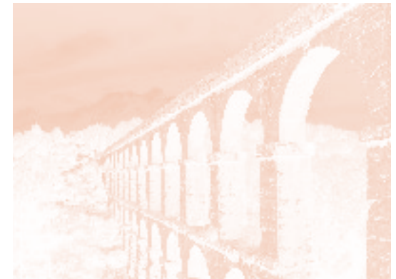
Brücken schlagen vom Einst zum Jetzt

Das altsprachliche Profil mit Latein und/oder Griechisch